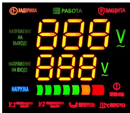
Рис. 3 Мультифункциональный цветной дисплей

! напряжение на выходе – отображает выходное напряжение стабилизатора