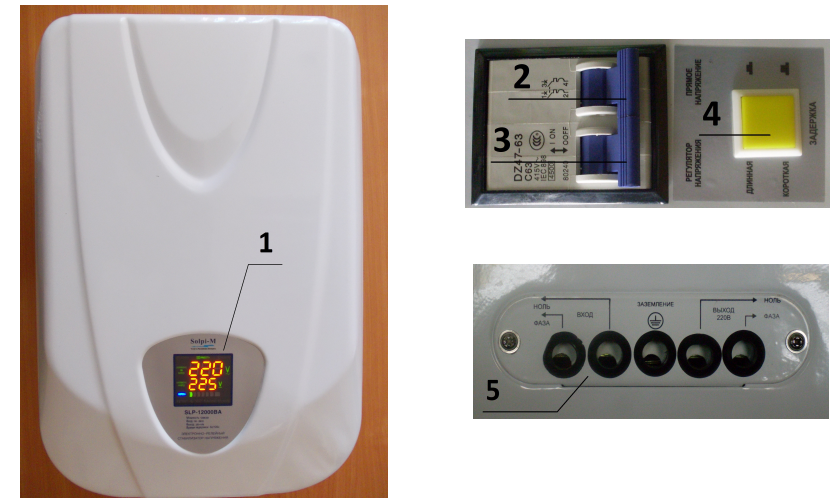
Рис. 1 Внешний вид стабилизатора