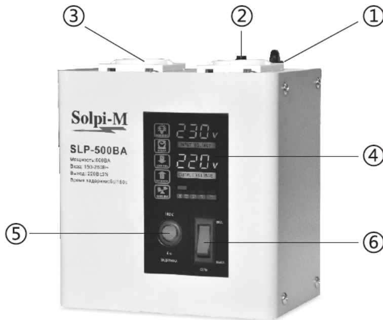
Рис. 1 Внешний вид стабилизатора.